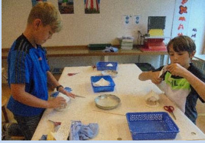
Anlegen und verstreichen der Gipsbandage bei Dach und Turm. Der Turm besteht aus 2 Dosen, welche zusammenschraubt sind.