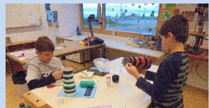
Bemalen und aufkleben der Luftmaschenketten.